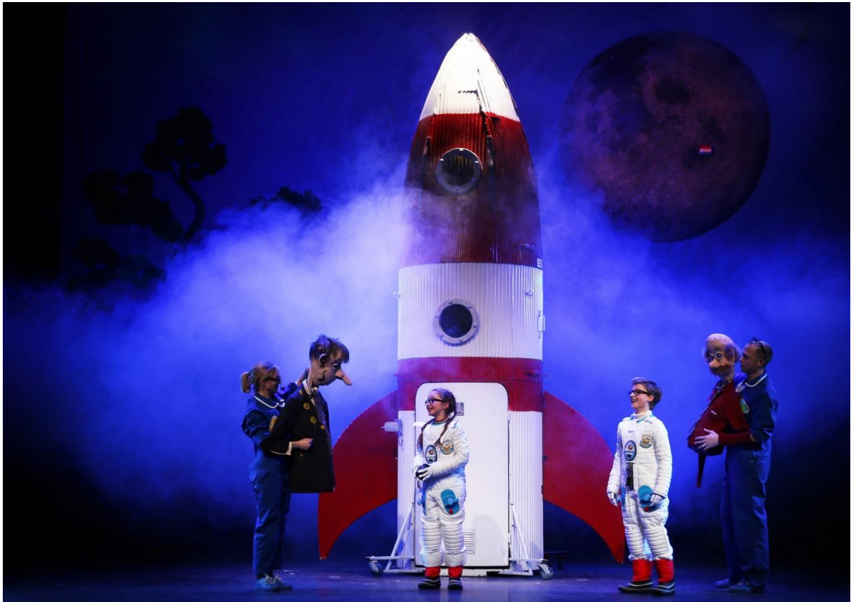
Fotograaf: Ermin de Koning. De foto's zijn rechtenvrij te gebruiken o.v.v. de fotograaf.