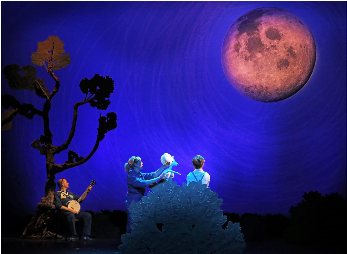
Fotograaf: Ermin de Koning. De foto's zijn rechtenvrij te gebruiken o.v.v. de fotograaf.